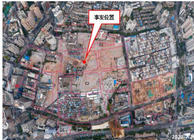
图 1 事发位置示意图