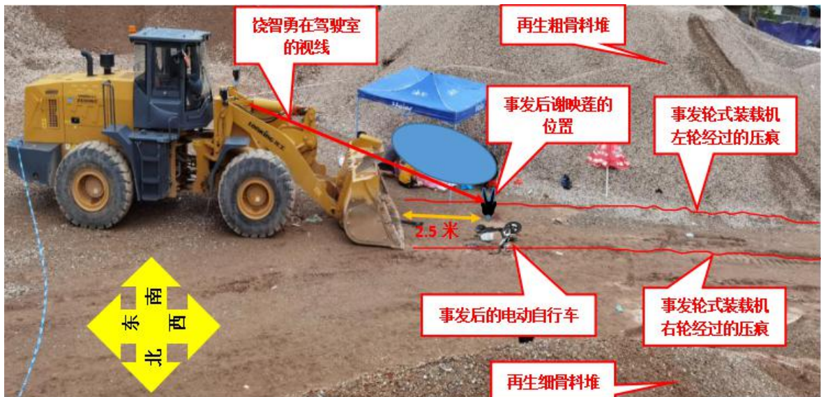
图 5 事发后谢映莲、轮式装载机、电动自行车位置勘查图

事发后，谢映莲面朝上、头朝再生细骨料堆、脚朝再生粗骨料堆躺在事发轮式装载机左前方地面上，身体距离事发轮式装载机铲斗约 2.5 米，身体两侧有事发轮式装载机左轮经过的地面压痕。（见图 5）