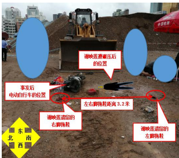
图 6 事发后谢映莲、电动自行车位置勘查图

行车西侧通道上，左脚穿的拖鞋掉落在事发轮式装载机左轮经过的地面压痕旁，两只拖鞋距离约 3.2 米。（见图 6、图 7）