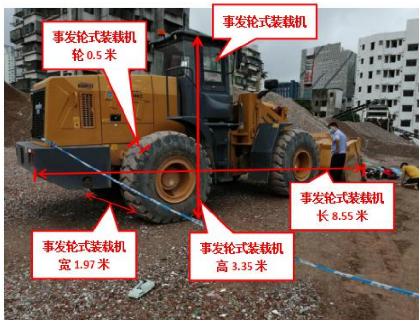
图 8 事发轮式装载机勘查图