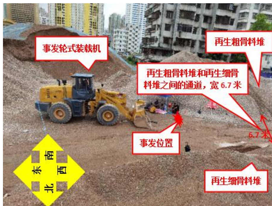
图 4 事发后事故现场勘查图

事发位置位于湖贝城市更新项目 C1 地块再生粗骨料堆和再生细骨料堆之间的通道处，该通道为泥土路面，通道宽 6.7 米。（见图 4）