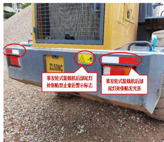
图 10 事发轮式装载机尾部勘查图