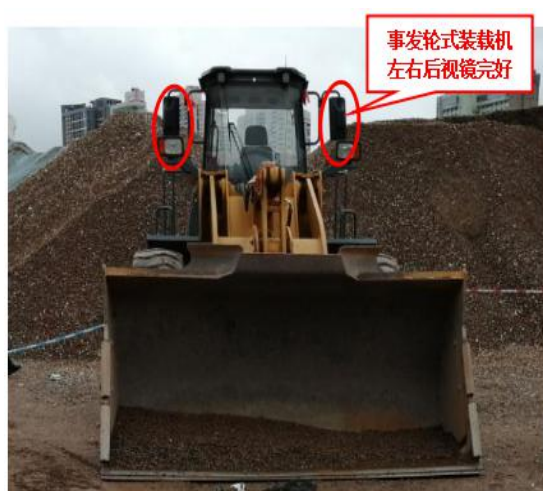
图 9 事发轮式装载机左、右后视镜勘查图