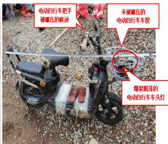
图 7 事发后电动自行车勘查图