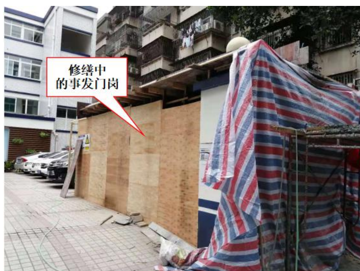
图 7 事发时事发门岗状况图

事发门岗为单层砖混结构。事发门岗修缮施工前，门岗室长为 4 米，宽为 2.5 米，高度为 2.7 米，门岗室顶部未设置雨棚。事发门岗修缮施工完成后，门岗室长为 4 米，宽为 2.5 米，高度为 3.0 米，门岗室顶部楼板增加了雨棚，顶部楼板（包括雨棚）长为 5.9 米，宽为 5.4 米。（见图 7、图 8）