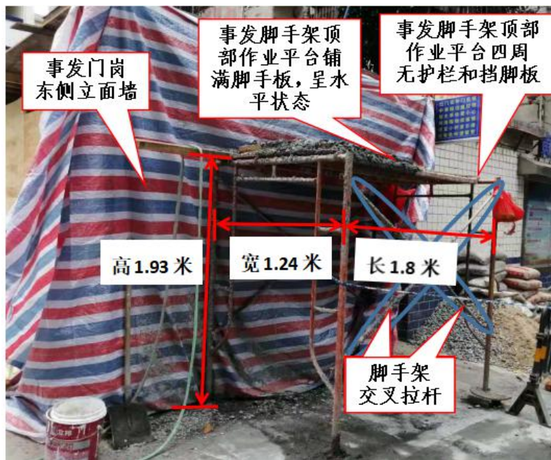
图 9 事发脚手架勘查图