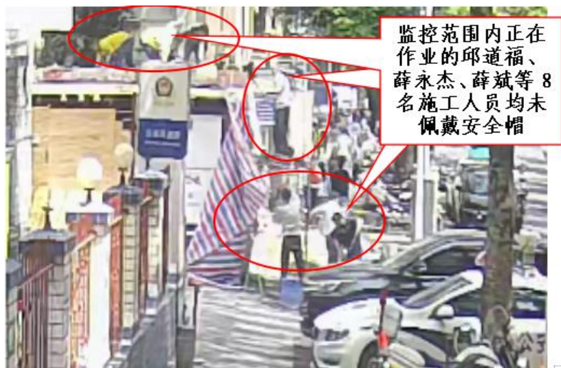
图 10 事发时施工现场施工人员佩戴安全帽情况监控视频截图