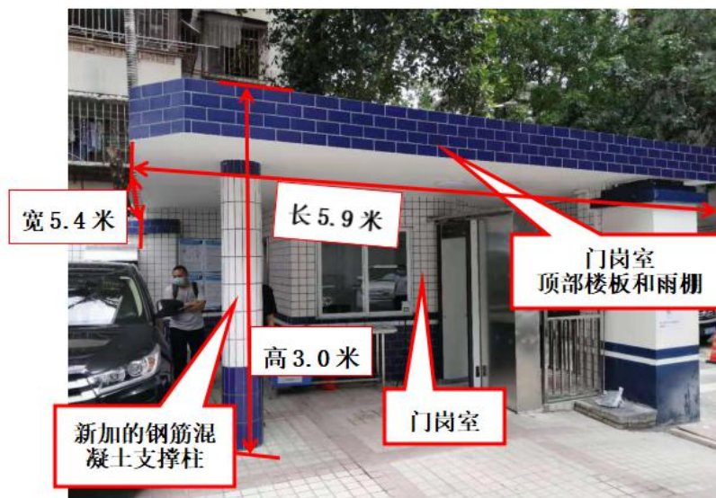
图8 事发门岗修缮施工完工后现状图