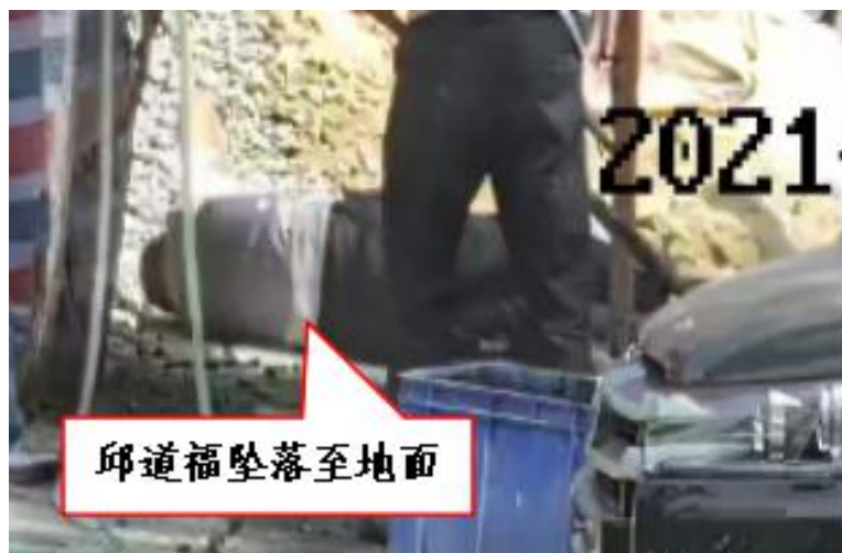
图 3 邱道福坠落至地面监控视频截图

图 3)。接着，刘家高等 4 名杂工将邱道福抬到事发脚手架北侧砂石堆旁的地面平放着。