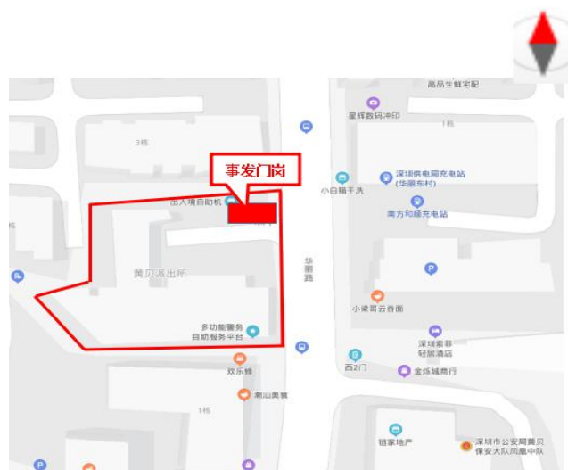
图 1 事发项目地理位置图

事发门岗修缮工程位于罗湖区黄贝街道新谊社区华丽路 1065 号（见图 1），事发门岗建筑面积约 32 平方米，工程费用约 4.9 万元。工程内容主要包括：拆除原事发门岗顶部钢筋混凝土楼板，事发门岗四面墙体砌高 0.3 米；重新浇筑事发门岗顶部钢筋混凝土楼板，重新铺设事发门岗内地面及门岗外过道地面瓷砖等。