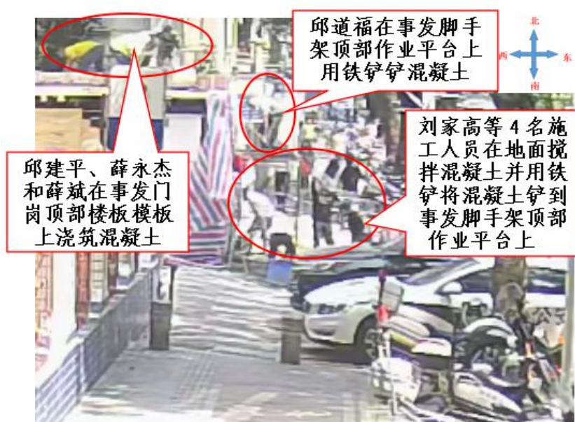
图 4 事发前事发门岗修缮工程施工现场作业情况监控视频截图

2021 年 4 月 18 日 10 时 56 分 12 秒，邱道福面朝南、左脚在前、右脚在后站在事发脚手架顶部作业平台北侧，用铁铲将地面施工人员铲到事发脚手架顶部作业平台南侧的混凝土铲到事发门岗顶部楼板模板上浇筑（见图 4）。