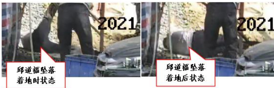
图 6 邱道福坠落至地面状态监控视频截图